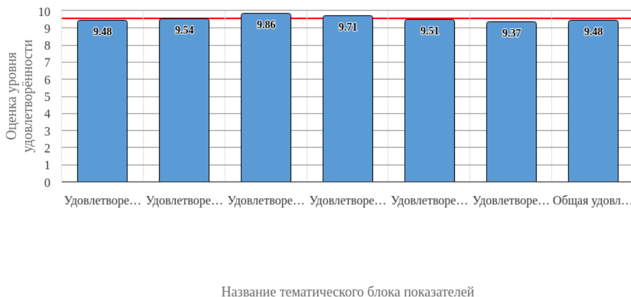
Рисунок 3.1 - Средняя оценка удовлетворенности (по всем тематическим блокам показателей)

Средняя оценка удовлетворенности респондентов по блоку вопросов «Удовлетворенность организацией обучения» равна 9.48, что является показателем высокого уровня удовлетворенности (75-100%).